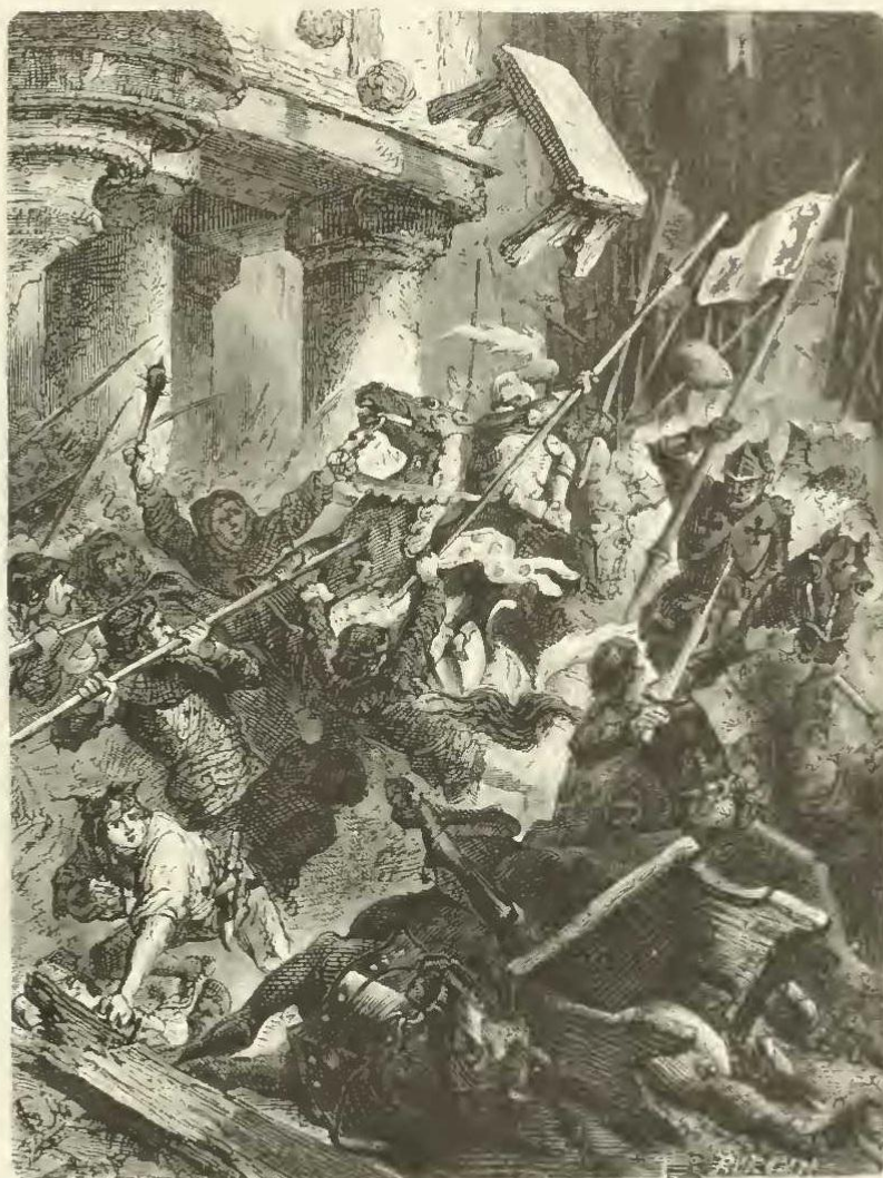
Les Parisiens chassant les Anglais.

Dès lors, le gouvernement français commença d'entrer dans d'autres voies. Des hommes nouveaux furent introduits dans ce conseil du roi où siégeait encore, mais où ne dominait plus le second des deux grands traîtres, l'archevêque chancelier Regnault de Chartres, qui avait renié son ancien complice la Trémoille. Les honnêtes gens, les patriotes, prirent le dessus, et l'on en vit les grandes suites au bout de quelques années.