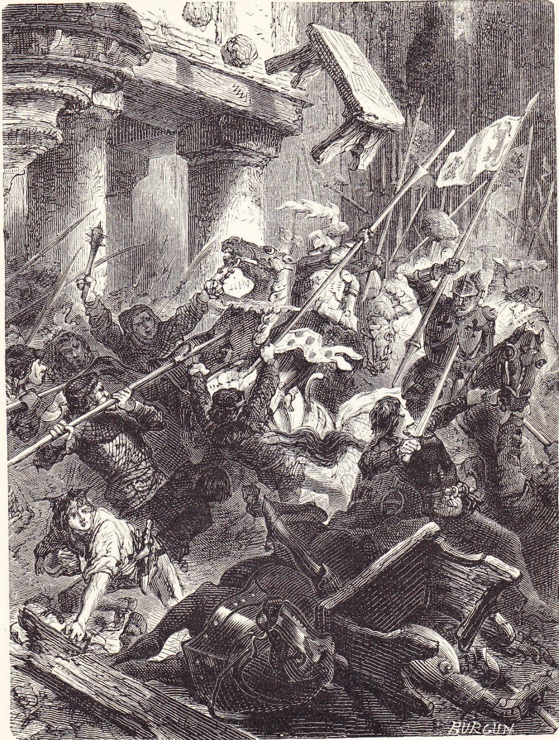
Les Parisiens chassant les Anglais (13 avril 1436).